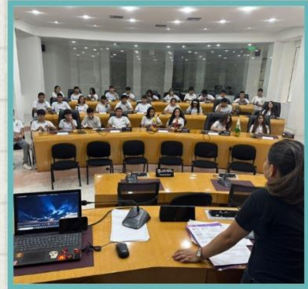
Colegio Andrés Bello