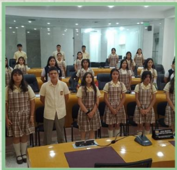
Colegio Carlos Pérez Escalante