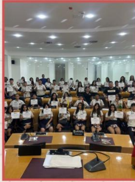
Colegio Rafael Uribe Uribe