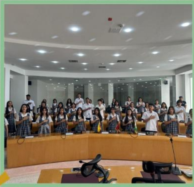
Institución Educativa Colegio San Bartolomé