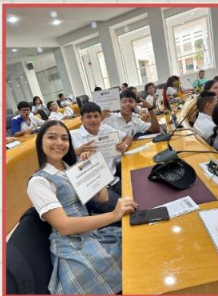
Colegio Básico Club de Leones