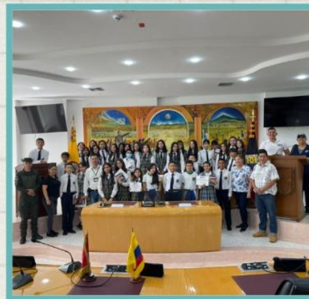
Colegio Nuestra Señora de Fátima